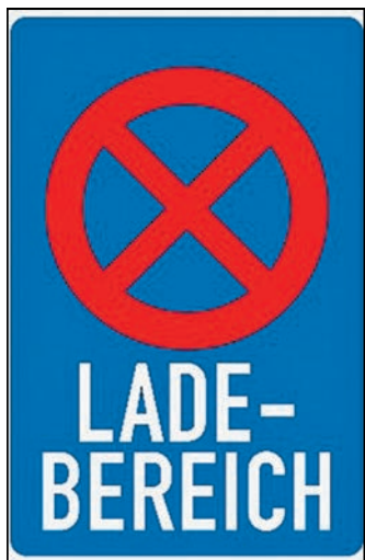
Das neue Schild in der Wendischen Straße Grafik: PS

Bautzen. Etwa in der Mitte der Wendischen Straße wurde ein Verkehrszeichen angebracht, das vielen Kraftfahrern noch unbekannt sein dürfte. Es wurde erst vor kurzem in die Straßenverkehrsordnung eingeführt. Bei diesem Zeichen gilt: Das Halten und Parken ist nur zum Be- und Entladen von Fahrzeugen ohne Verzögerungen zulässig. Gewerbetreibende der Wendischen Straße hatten angeregt, eine Fläche zu schaffen, die ausschließlich dem Lieferverkehr vorbehalten ist. Zwar darf zum Be- oder Entladen auch auf den dortigen gebührenpflichtigen Parkplätzen gehalten werden, die Parkplätze sind jedoch fast immer belegt.