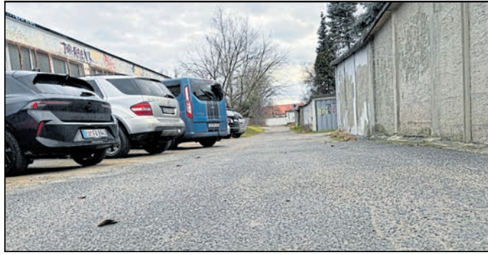
Dieser namenlose Weg an der Turnhalle der Allende-Oberschule (links im Bild) soll 2025 grundhaft ausgebaut werden.

Ob diese ausreichen, um das marode Schulgebäude zu sanieren, muss sich zeigen. Alternativ könnte von dem Geld auch die ebenso lang ersehnte Dreifeld-Turnhalle gebaut werden.