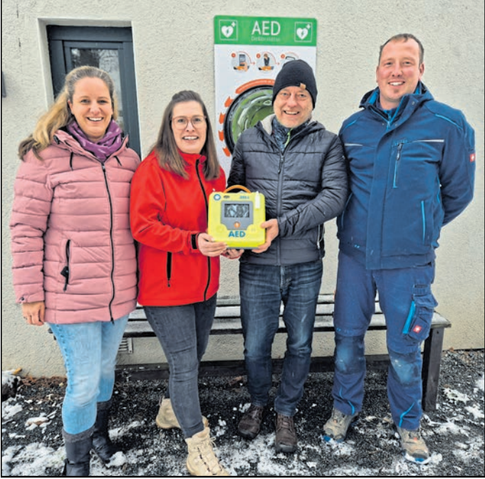
Mehr Sicherheit für Neukirch: Defibrillator am Mehrgenerationenhaus