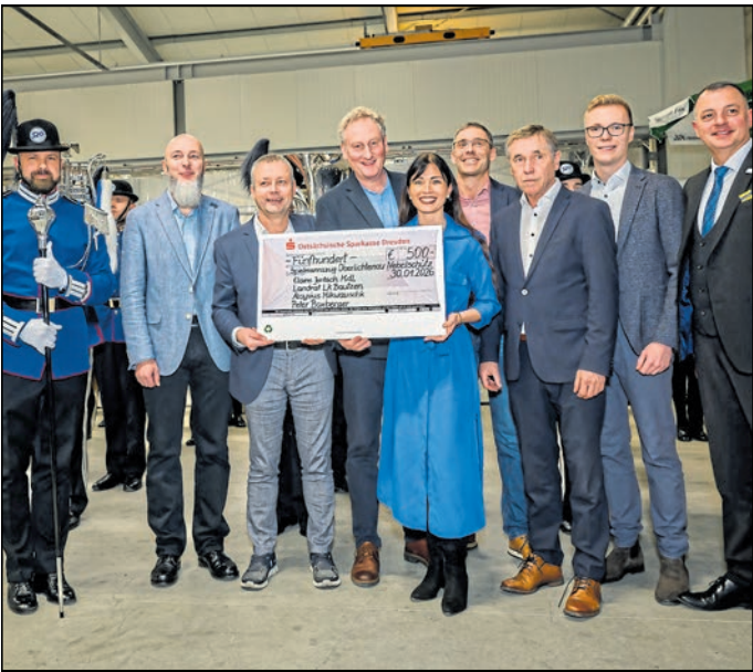
Die MIT Bautzen würdigte das Engagement des Spielmannszugs Oberlichtenau mit 500 Euro.