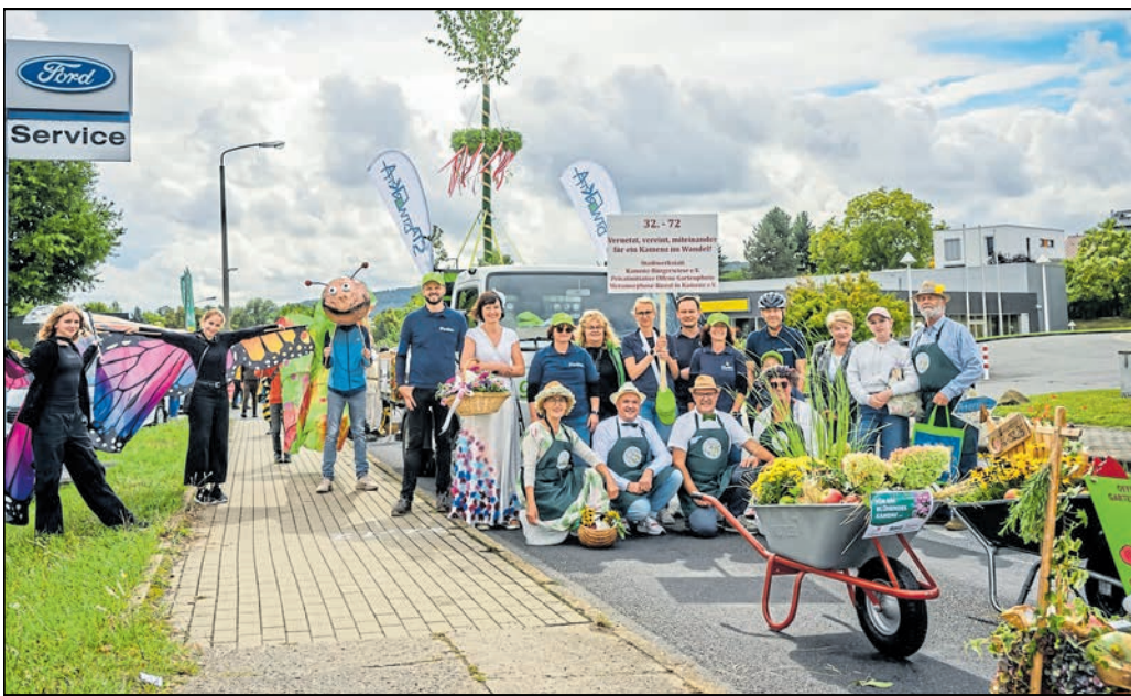
Die Stadtwerkstatt Kamenz spielt eine tragende und verbindende Rolle in der Lessingstadt und ist natürlich auch beim Stadtjubiläum präsent.

Danach beriet man, was davon umgesetzt werden sollte, und stimmte darüber ab. Die Mitglieder gehen mit offenen Augen und Ohren durch ihre Stadt, sehen, was fehlt, greifen Probleme auf oder setzen um, was sie sich wünschen. Zu den Sparten des Vereins gehören Kinder- und Jugendarbeit, Poli-