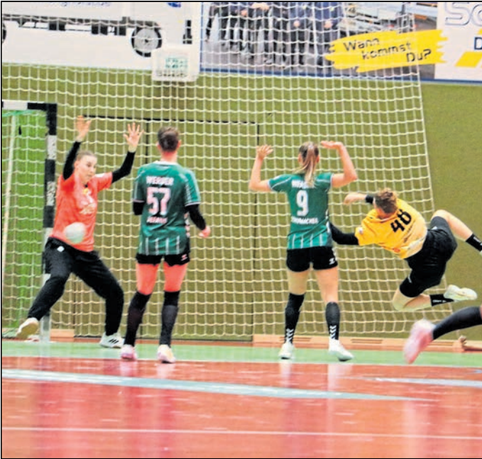
Der schwer erkämpfte Sieg aus der Hinrunde ist noch in bester Erinnerung.

Nach zuletzt zwei weiten Auswärtsspielen in Freiburg und Rostock läutet der Tabellen-Dritte aus Rödersdorf gegen die Grün-Weißen seine Heimspielwochen ein. Nach Werder reisen dann die Teams aus Waiblingen und Solingen-Gräfrath ins Bienenland. „Das wird unserem Team wirklich helfen. Drei Heimspiele hintereinander sind auch für unsere Fans selten und schön zugleich“, meinte die HCR-Trainerin.