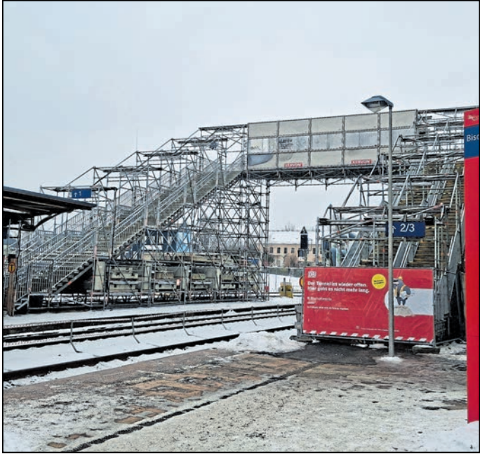
Die Zeit der Einschränkungen durch die Brücke zum Inselbahnsteig ist nun vorbei.

Professionelle Webseite für 47€ im Monat. Punkt. Ohne wenn und aber! www.dieonlinemacher.net