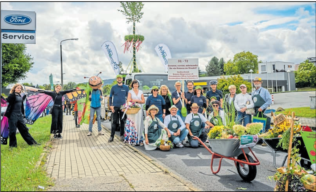
Die Stadtwerkstatt Kamenz spielt eine tragende und verbindende Rolle in der Lessingstadt und ist natürlich auch beim Stadtjubiläum präsent.

sich entschieden, berichten sie, weil in einer Werkstatt gearbeitet, getüftelt, geplant und repariert werde, genau wie in den Vereinsräumen an der Kirchstraße, Ecke Rosa-Luxemburg-Straße in Kamenz. Beim ersten Treffen im Januar beschlossen die Mitglieder am selbstgebauten runden Holztisch ein vielfältiges Programm für 2026. Die einzelnen Projekte und Aktivitäten notierte man auf gelben und roten Zetteln und befestigte sie an einer Pinnwand. Danach beriet man, was davon umgesetzt werden sollte, und stimmte darüber ab. Die Mitglieder gehen mit offenen Augen und Ohren durch ihre Stadt, sehen, was fehlt, greifen Probleme auf oder setzen um, was sie sich wünschen. Zu den Sparten des Vereins gehören Kinder- und Jugendarbeit, Poli-