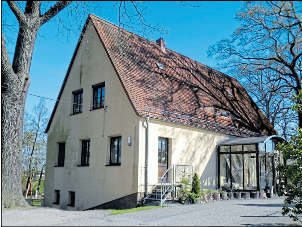
Das Flurstück sowie die darauf befindliche Gebäudesubstanz werden zur Erfüllung kommunaler Pflichtaufgaben nicht mehr benötigt.

fahrung schärft das Gehör und das Gespür für das Miteinander, heißt es. Die Akademie ist auch ein Ort der Begegnung und Vernetzung. Gleichaltrige mit ähnlicher Leidenschaft und Ambition aus der gesamten Oberlausitz treffen hier zusammen. Beim gemeinsamen Proben, Musizieren und Austausch entstehen nicht nur einzigartige Klänge, sondern oft auch bleibende Freundschaften und ein starkes Motivationsnetzwerk. In lockerer Atmosphäre eröffnet sich zudem die Möglichkeit, mit erfahrenen Musikern über künstlerische und berufliche Perspektiven zu sprechen. Den Höhepunkt der gemeinsamen Arbeit bildet das öffentliche Abschlusskonzert am Sonntag, 16. August, um 11.00 Uhr, in der Ev.-luth. Kirche Baruth. Vor einem aufmerksamen Publikum präsentieren die Ensembles die erarbeiteten Werke.