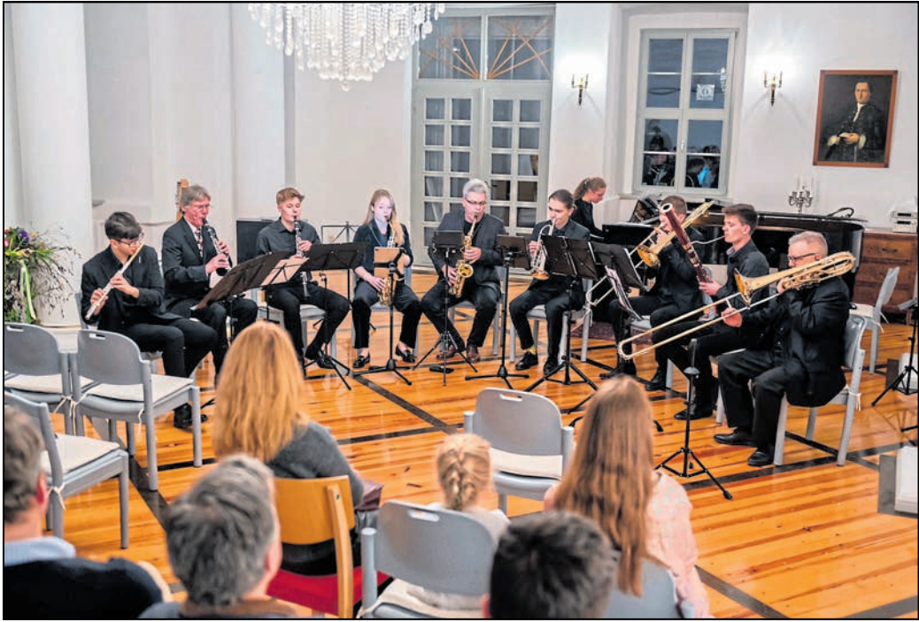
Zum dritten Mal lädt die Kammermusikfest Oberlausitz Akademie junge Musikerinnen und Musiker ein, gemeinsam unter professioneller Anleitung zu musizieren. Eine Bewerbung ist bis 31. März 2026 möglich.

„Wenn du bereit bist für diese intensive, bereichernde und freudvolle Reise in die Welt der Kammermusik, dann zögere nicht! Nutze diese einzigartige Gelegenheit, dein Spiel zu vertiefen, unschätzbare Erfahrungen zu sammeln und Teil einer besonderen musikalischen Gemeinschaft zu werden. Bewirb dich bis zum 31. März 2026“, heißt es dazu in einem Aufruf. Alle Informationen zur Bewerbung für die dritte Ausgabe der Akademie sind unter www.kammermusikfest-oberlausitz.de zu finden. Die Kammermusikfest Oberlausitz Akademie ist ein Bestandteil des Kammermusikfestes Oberlausitz und findet im zweijährlichen Wechsel mit dem Festival statt. Sie wird ermöglicht durch die Förderung der Kulturstiftung des Freistaates Sachsen, des Kulturraums Oberlausitz-Niederschlesien sowie der Landkreise Bautzen und Görlitz.