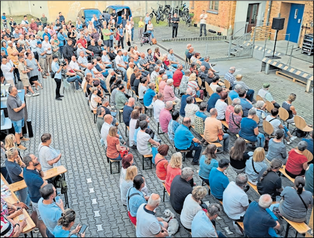
Die Stadtwerkstatt Kamenz möchte eine Plattform für bürgerschaftliches Engagement sein und stellt gemeinsam mit Partnern zahlreiche Veranstaltungen auf die Beine.