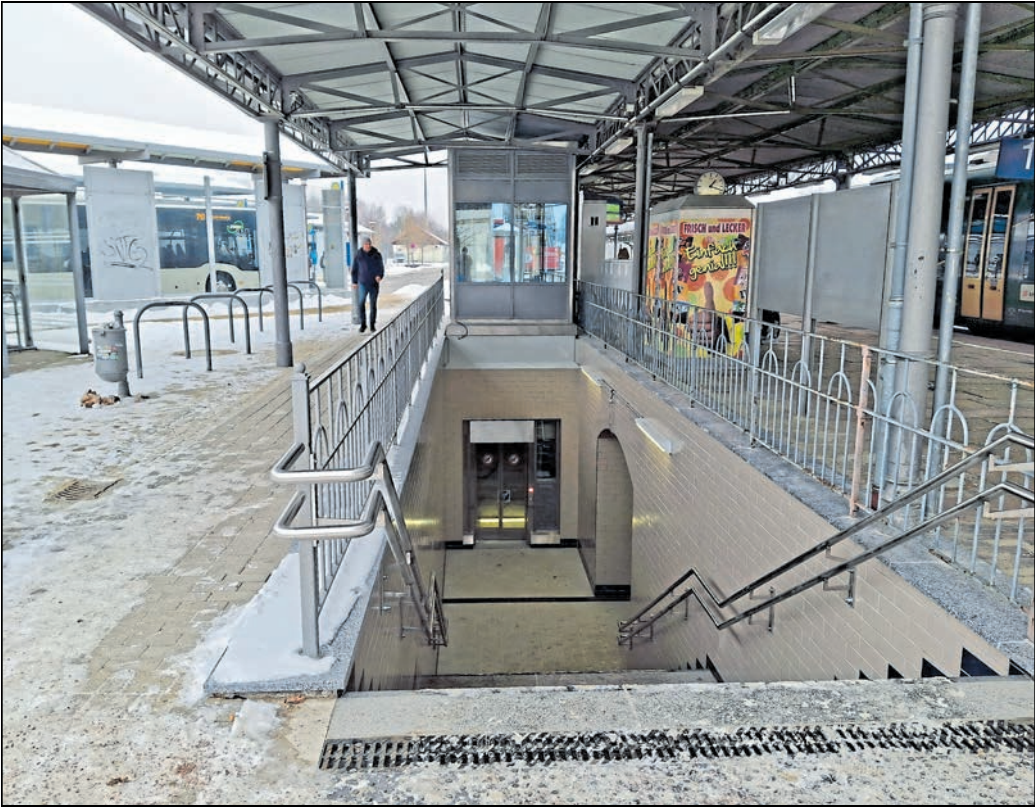
Die DB sanierte seit November 2023 das Treppenhaus auf Bahnsteig 2/3 nach Denkmalschutzvorgaben und erneuerte die Bahnsteigdächer sowie die Treppen der Personenunterführung. Für den barrierefreien Zugang erhielten die Aufzüge auf den Bahnsteigen zusätzliche Rampen.

Die DB sanierte seit November 2023 das Treppenhaus auf Bahnsteig 2/3 nach Denkmalschutzvorgaben und erneuerte die Bahnsteigdächer sowie die Treppen der Personenunterführung. Die „Mundhäuser“ der Aufzüge wurden so errichtet, so dass sie bei einer späteren Erhöhung der Bahnsteige weiter genutzt werden können. Für den barrierefreien Zugang erhielten die Aufzüge auf den Bahnsteigen zusätzliche Rampen. Der Personentunnel wurde instandgesetzt, der Boden erneuert und die Wände neu gefliest. Außerdem erhielten die Unterführung und die Treppen eine neue Beleuchtung. „In diesem Jahr werden mit dem Rück-