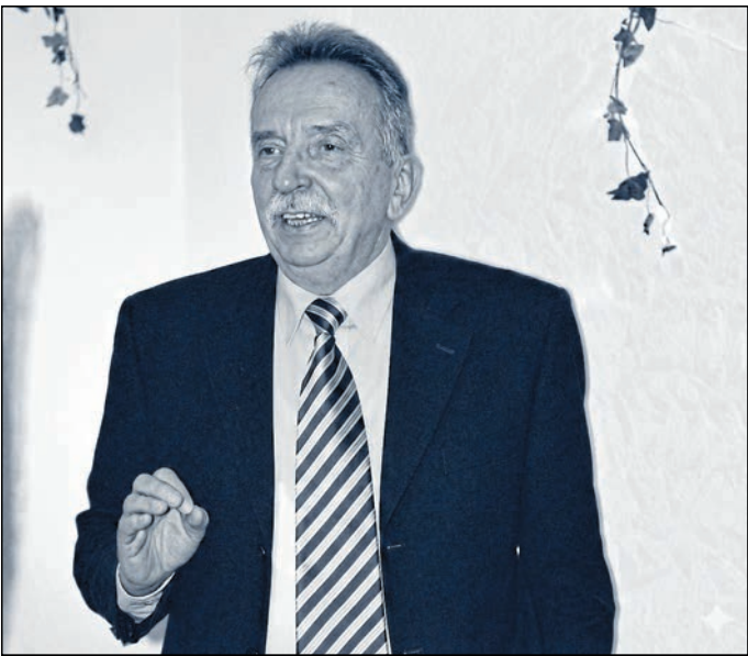
Der frühere Landrat des Landkreises Bautzen, Horst Gallert, ist im Alter von 88 Jahren verstorben.

Landkreis. Das Landratsamt Bautzen trauert um Landrat a.D. Horst Gallert, der im Alter von 88 Jahren verstorben ist. In einem Nachruf seiner Nachfolger Michael Harig und Udo Witschas heißt es: „Von 1992 bis 2001 leistete Horst Gallert als Landrat des Landkreises Bautzen einen entscheidenden Beitrag zum Aufbruch des Landkreises nach der Friedlichen Revolution und der Wiedervereinigung. Wesentliche Entscheidungen und Investitionen seiner Amtszeit bilden die Grundlage für unser Handeln heute. Unvergessen ist insbesondere sein Einsatz für die Kultur, vornehmlich für das Deutsch-Sorbische Volkstheater. Das Burgtheater Bautzen und der Neubau der Inneren Abteilung des Klinikums seien hier als Beispiele für das Bleibende genannt,