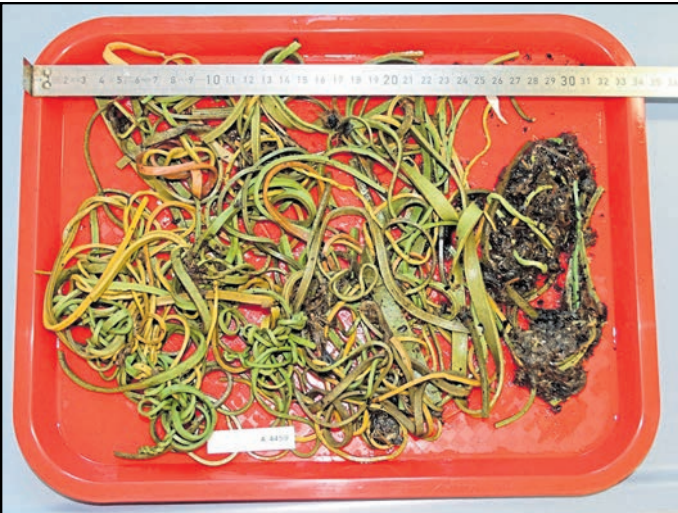
Der Mageninhalt des am 19. Juli dieses Jahres verendeten Storchs in Ostritz

Landkreis Görlitz. Der Unteren Naturschutzbehörde des Landkreises Görlitz wurden 2025 mehrere verendete Jungstörche gemeldet. Die Untersuchung eines Jungstorchs aus Ostritz durch das Senckenberg-Museum für Naturkunde Görlitz ergab, dass sich eine große Anzahl von Gummiringen im Magen befunden haben. Eine ähnliche Feststellung wurde bereits 2023 im Hinblick auf die Speiseröhre eines toten Storchs festgestellt. 2024 wurde ein Tier aus Zoblit in den Tierpark Görlitz eingeliefert. Das Tier bracht nach kurzer Zeit viele Gummibänder heraus und konnte wieder freigelassen werden konnte.