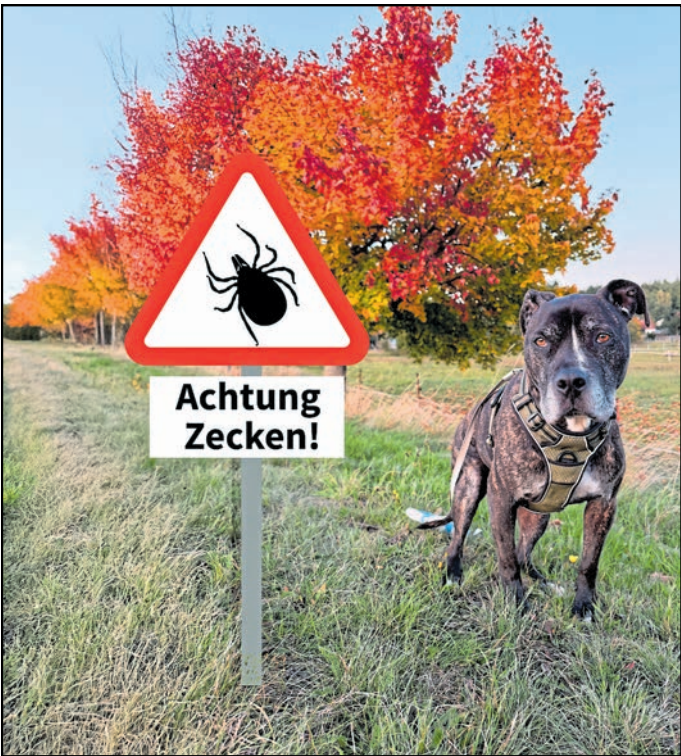
Seit 2022 breitet sich die Auwaldzecke in Ostsachsen aus und bedroht auch in den Wintermonaten das Leben und die Gesundheit von Vierbeinern.

Mittlerweile sei auch „das ganze Ostgebiet von Dresden sehr intensiv betroffen.“ Der Appell des Experten gilt der Vorbeugung. „Ganz, ganz wich-