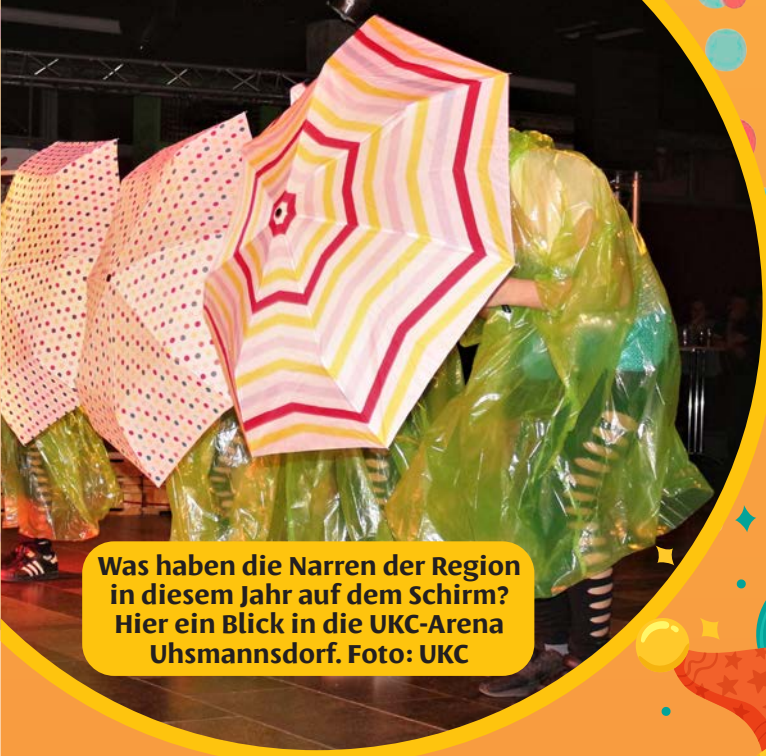
Was haben die Narren der Region in diesem Jahr auf dem Schirm? Hier ein Blick in die UKC-Arena Uhmanssdorf.

Region. 250 Karnevalisten aus 35 Vereinen des Verbandes Sächsischer Carneval e.V. haben am 30. Januar beim Ministerpräsidenten ihre Aufwartung gemacht und das närrische Treiben in der Staatskanzlei auf die Spitze getrieben. Nun geht es in die Fläche. Bei den Karnevalsvereinen im Einzugsgebiet des Niederschlesischen Kuriers hat die Redaktion angefragt, was ansteht.