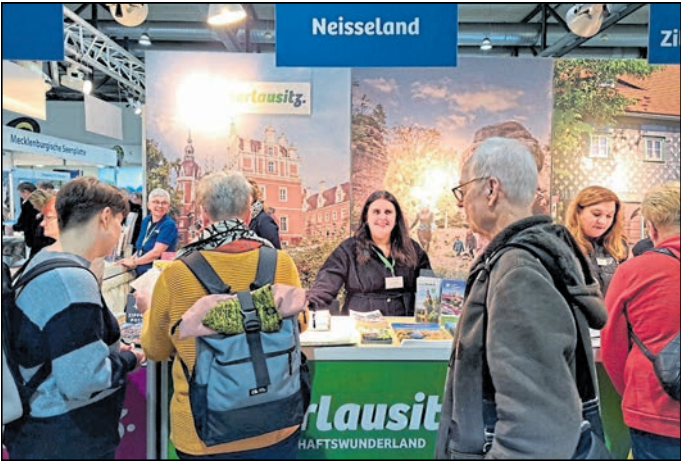
Am Stand der TGG Neißeland auf der Messe in Dresden

Die Verzahnung der Gebiets-körperschaften dürfte aus Sicht eines gemeinsamen Verständ-nisses der Produktentwicklung sowie des Fördermittel- und Projektmanagements gleich-wohl sinnvoll sein. Dieses unterscheide klar zwischen „ge-meinschaftlichen Grundaufga-ben und projektbezogenen Lei-stungen, um Ressourcen effizient einzusetzen. So vermeidet er (der Verband) Doppelstruktu-ren und stärkt die Zusammen-arbeit zwischen kommunalen und privaten Akteuren“, heißt es in der neuen Selbstcharakte-