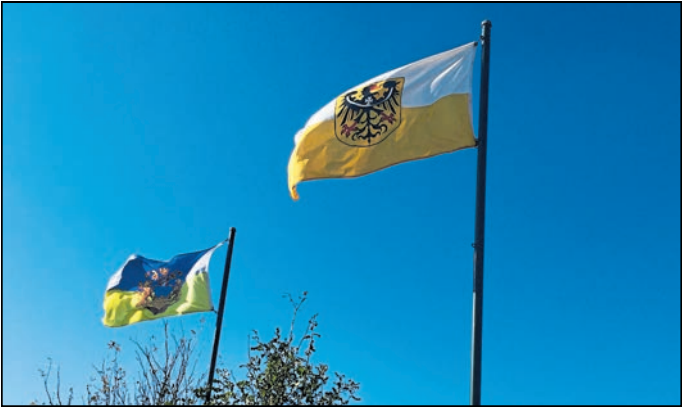
Es geht im Tourismus auch gleichberechtigt: Am Freizeit- und Campingpark Thräna in der Gemeinde Hohendubrau wird die Oberlausitz-, wie die Schlesischeflagge gehisst.

Region. Der deutsche Teil der Oberlausitz geht mit einem neuen „Tourismusverband Oberlausitz e.V. (TVO)“ in die Vermarktung ihrer landschaftlichen und architektonischen Vorzüge. Der neue Verband vereint Kommunen, Unternehmen beider deutsch-oberlausitzer Landkreise und übernimmt nach eigener Sprachregelung schrittweise die Aufgaben der bisherigen Marketing-Gesellschaft Oberlausitz-Niederschlesien mbH (MGO). Eine Neukonzeption war nötig geworden, da die Sparkassen aus der bisherigen Tourismusvermarktung ausgestiegen waren. Der Austritt der Sparkasse Oberlausitz-Niederschlesien, der Kreis-sparkasse Bautzen und der Ost-sächsischen Sparkasse Dresden war zum 31. Dezember 2025 wirksam geworden.