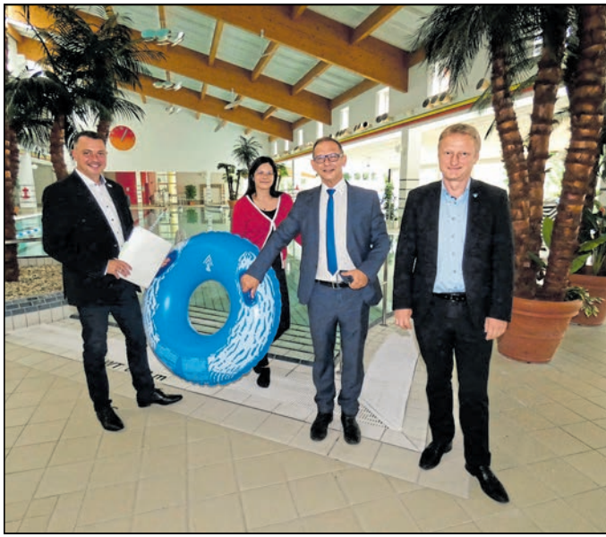
Landrat Udo Witschas (li.) warf dem Zweckverband schon vor einiger Zeit den Rettungsring zu.

Ziel ist eine deutliche Reduzierung der Betriebskosten im energetischen Bereich“, heißt es dazu. Ziel der Maßnahmen ist es laut dem vom Ingenieurbüro Bauconzept aus Lichtenstein/Sachsen verfassten Erläuterungsbericht, „nicht funktionierende oder nicht mehr zeitgemäße Strukturen durch optimierte Abläufe und ein besseres Angebot für die Besucher zu ersetzen. Den größten Eingriff stellt hiernach „die Verlegung