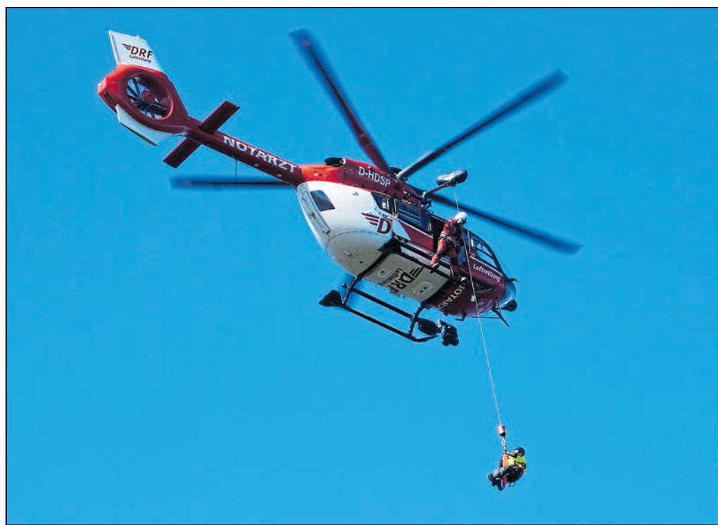
Der Windenbediener lässt den Retter von der Feuerwehr über etwa 45 Meter am Seil herab. Unter ihm hofft der Verunglückte auf seine Rettung.