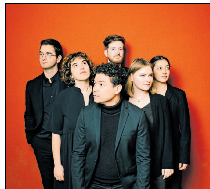
Das Alafia-Ensemble verbindet klassische Musiktradition mit innovativen Arrangements.