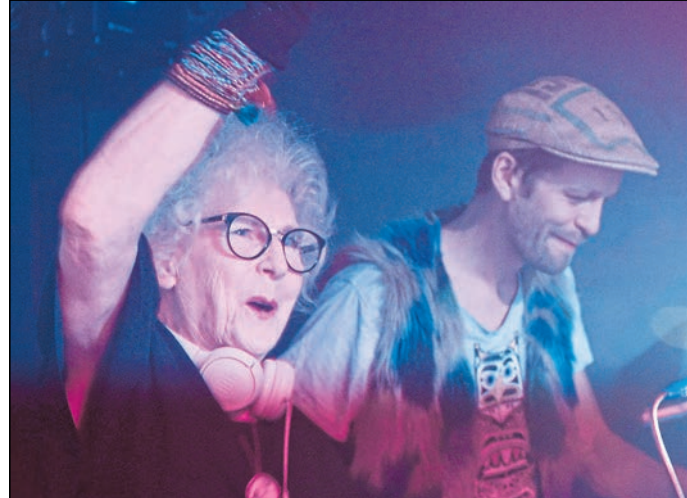
Am 26. März zeigt das Bautzener Steinhaus den Dokumentarfilm „Vika!“ über die älteste DJ Polens.

Bautzen. Am Mittwoch, 26. März, zeigt das Kino im Bautzener Steinhaus im Rahmen der Frauen-Aktionswochen den Dokumentarfilm „Vika!“. Der Film porträtiert die 85-jährige Vika, die als älteste DJ Polens die Clubs von Warschau begeistert und mit ihrer Energie und Leidenschaft für Musik die Tanzflächen unsicher macht. Vika ist eine Ikone, die sich weigert, sich vom Alter oder gesellschaftlichen Erwartungen einschränken zu lassen. Statt in den Ruhestand zu gehen, lebt sie ihren Traum und feiert das Leben in vollen Zügen. Der Film zeigt, wie sie nach einer Karriere als Gefängnispädagogin und einem Leben, das oft von den Bedürfnissen anderer geprägt war, endlich ihre eigene Leidenschaft entdeckte. „Vika!“ ist mehr als nur ein Film über Musik – er erzählt eine inspirierende Geschichte über Selbstentdeckung, Mut und die Kraft, sich neu zu erfinden. Vika beweist, dass es nie zu spät ist, Träume zu leben und das Leben zu genießen. Der Dokumentarfilm ermutigt die Zuschauer, sich von gesellschaftlichen Normen zu befreien und ihren eigenen Weg zu gehen. Die Veranstaltung beginnt um 20 Uhr, Einlass ist ab 19 Uhr. Der Eintritt beträgt 7 Euro an der Abendkasse. Ein Abend, der nicht nur unterhält, sondern auch inspiriert und dazu einlädt, das Leben aus einer neuen Perspektive zu betrachten.