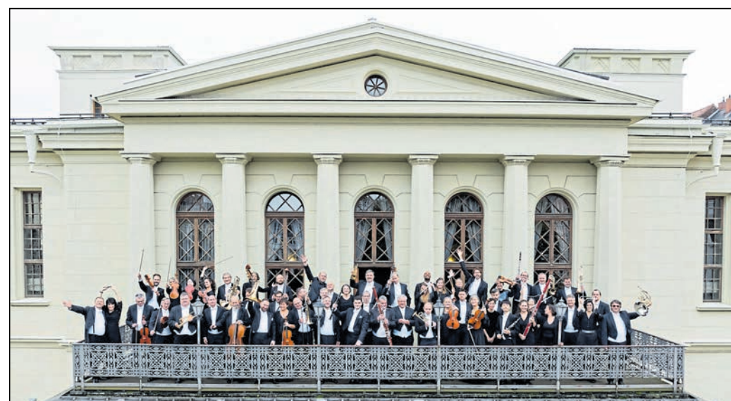
Die Neue Lausitzer Philharmonie auf dem Balkon des Theaters in Görlitz. An fünf Abenden wird ihr Sinfoniekonzert an verschiedenen Spielstätten der Oberlausitz zu erleben sein.

Bautzen / Görlitz / Zittau / Hoyerswerda. Das Gerhart-Hauptmann-Theater präsentiert mit dem 6. Philharmonischen Konzert der Neuen Lausitzer Philharmonie unter dem Titel 'Vom Tellerwäscher zum Millionär!' ein Programm, das amerikanische Musikgeschichte erzählt. Neben George Gershwin und Samuel Barber wird als Höhepunkt die Gälische Sinfonie op. 32 von Amy Beach erklingen. Karten gibt es unter www.g-h-t.de . Veranstaltungsort und Termine sind am 10. April, 19.30 Uhr, im Deutsch-Sorbischen Volkstheater Bautzen (Premiere), am 11. und 15. April, jeweils 19.30 Uhr, im Großen Saal des Hauses Görlitz, am 12. April, 19.30 Uhr, im Großen Saal des Hauses Zittau und am 13. April, 18.00 Uhr, in der Lausitzhalle Hoyerswerda.