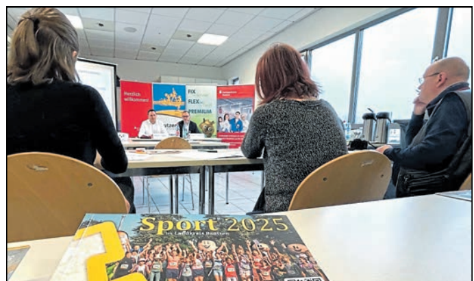
Trotz der positiven Entwicklungen stehen die Sportvereine vor großen Herausforderungen.

Hinzu kommt der akute Mangel an Übungsleitern und ehrenamtlichen Helfern, die für den Betrieb der Vereine unverzichtbar sind. Der Kreissportbund betont, dass ohne eine Verbesserung der Rahmenbedingungen das Wachstum des Vereinssports langfristig gefährdet ist. Dennoch bleibt der organisierte Sport im Landkreis Bautzen eine tragende Säule der Gesellschaft, die Gesundheit, Gemeinschaft und Integration fördert.