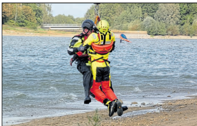
Am Strand angekommen gilt es für den Helfer, den Verletzten behutsam von den Gurten zu lösen.

■ Wenn Menschen in Not geraten, dann ist schnelle Hilfe erforderlich – nicht nur an Land, sondern auch im Wasser. Vor wenigen Tagen wurde dies über dem Bautzener Stausee geübt.