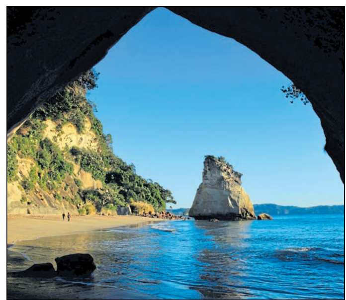
Sven Oyen entführt sein Publikum mit Großbildprojektion in ein Paradies im Südpazifik.

Görlitz. Auf Reisen durchstreifte Sven Oyen Neuseeland auf den eindrucksvollsten Wander-, Kajak- und Wohnmobiltouren zwischen Cape Reinga und Stewart Island. Auf wenig bekannten Routen ließ sich die Ursprünglichkeit der immergrünen Inselwelt erleben. Er berichtet davon am 14. April, 17.00 Uhr, im Filmpalast Görlitz. Der subtropische Norden bietet Südestrände, riesige Sanddünen und uralte Kauriwälder. Das Paradies für Wassersportfreunde, die Bay of Islands, birgt auch viel Historisches. Über die Metropole Auckland geht es zur reizvollen Coromandel Halbinsel und entlang der Bay of Plenty zum geothermischen Wunderland Rotorua, wo die Kultur der Maoris besonders gepflegt wird. Die Vulkane des Tongariro-Natio-