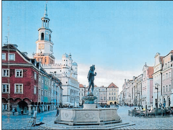
Der abendliche Vortrag entführt die Besucher nach Großpolen (Wielkopolska)