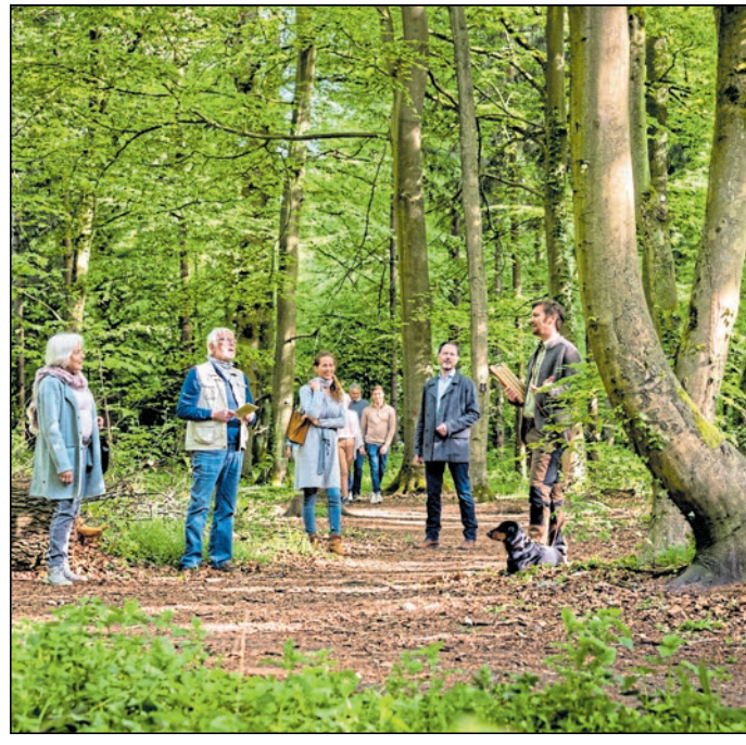
FriedWald-Förster erklären bei einer kostenlosen Führung durch den Bestattungswald die Bestattung in der Natur.

Waldes entdecken. Treffpunkt ist am Parkplatz Spitzberg P2, Am Schloss 4, in Deutsch-Paulsdorf. Die Waldführungen finden regelmäßig statt und sind in der Teilnehmerzahl für eine angenehme Gruppengröße begrenzt. Weitere Termine und Anmeldungen gibt es im Internet unter www.friedwald.de/markersdorf .