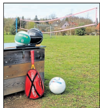
In Ober-Neundorf gibt es nun städtisches Spielgut.

Bällen bestückt. Sie sind nach Gebrauch wieder in die vorgeesehenen Boxen zurückzulegen.