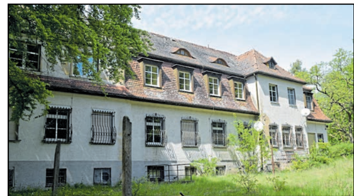
Das alte Jagdschloss bei Rietschen dient im eingeschränkten Maße bereits Umweltmaßnahmen und soll nun auch fit für Gäste gemacht werden.

Niederspre. Der Naturschutzstation „Östliche Oberlausitz“ e.V. erhält mehr als 3,9 Millionen Euro aus Mitteln des Investitionsgesetzes Kohleregionen. Mit dem Geld soll das leerstehende Schloss Niederspre in der Gemeinde Hähnichen saniert und umgebaut werden, um künftig als Schullandheim und Zentrum für Umweltbildung genutzt zu werden. Für diesen Freitag, und damit nach Redaktionsschluss für diese Ausgabe, war die Überreichung des Förderbescheides durch Staatsmi-