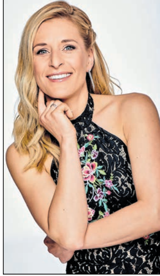
Stefanie Hertel gastiert bei der Schlager-Show „Hit auf Hit“ auf der Waldbühne Jonsdorf.