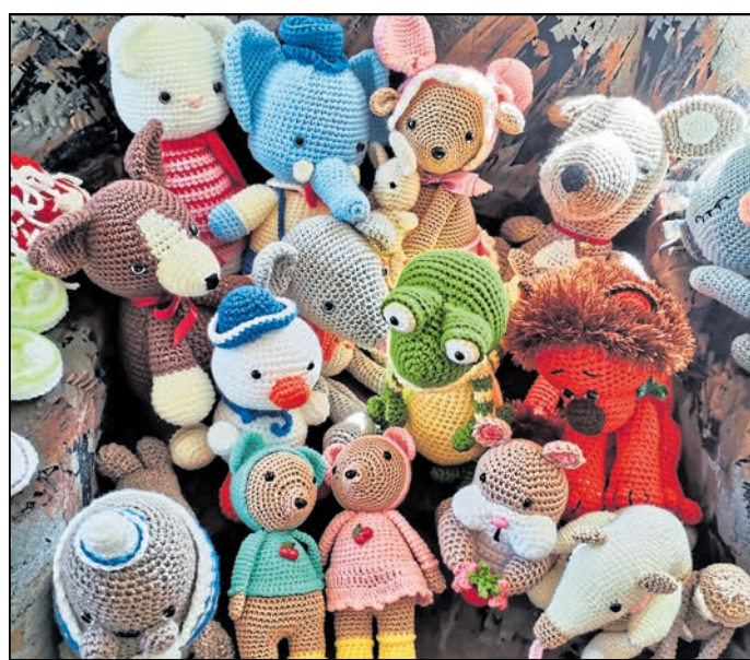
Neben praktischen Bekleidungsgegenständen bereiten auch selbstgemachte Kuscheltiere immer wieder Freude.

Landkreis Görlitz. Neugeborene im Landkreis Görlitz dürfen sich über einen Willkommensbesuch „Guter Start“ freuen, der mit einem Geschenk von den Strick- und Nähpatinnen noch verstüft wird. Nun wurde jedoch das letzte Wollknäuel und die letzten geeigneten Stoffe für die Herstellung von Babymützen, Hosens oder Knistertüchern verarbeitet. Damit es mit den Gaben weiterhin klappt, wird jetzt nach Wollspenden, Woll- und Stoffresten, Füllwatte und Stoffe, aus denen sich viele schöne Sachen für Babys herstellen lassen, gesucht. Derzeit liegen nach Infos aus dem Landratsamt Handarbeiten von etwa 40 Strickpatinnen vor. Sachspenden können in der Bahnhofstraße 24 in Görlitz oder an den anderen Landkreisstandorten abgegeben werden. tsk