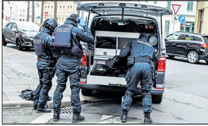
Ein Sondereinsatzkommando bei einem Einsatz in der Görlitzer Luisenstraße.

zahlen hätten die Menschen in der Oberlausitz „auch im Jahr 2024 sicher gelebt.“ Die Polizeidirektion begründet dies mit statistischen Angaben zur Kriminalitätsentwicklung, basierend auf der Polizeilichen Kriminalstatistik (PKS).