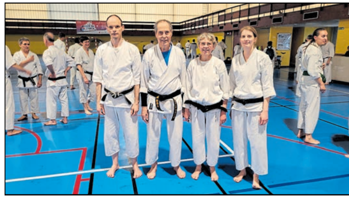
Die die beiden Nieskyer beim Karate-Training in einer Sporthalle auf dem Sport-Campus der Universität Reims