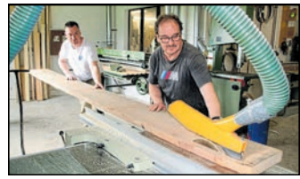
Das Handwerk bildet Lehrlinge in 130 Berufen aus.