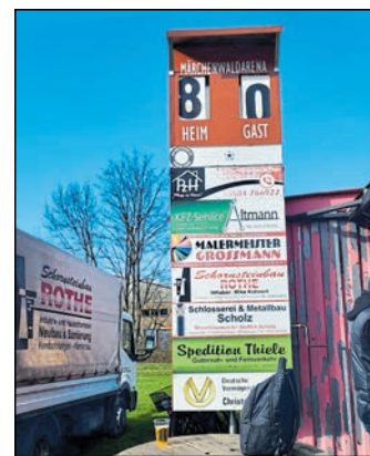
8:0 schickte Zodel Weißwasser heim.

Zodel. Vom 14. bis 17. April gastiert der Projektzirkus Jeffrey Hein in der Grundschule Zodel. Am Montag und Dienstag üben die Schüler ihre Auftritte als Fakire, Tänzerinnen, Zauberer, Clowns und vieles mehr ein.