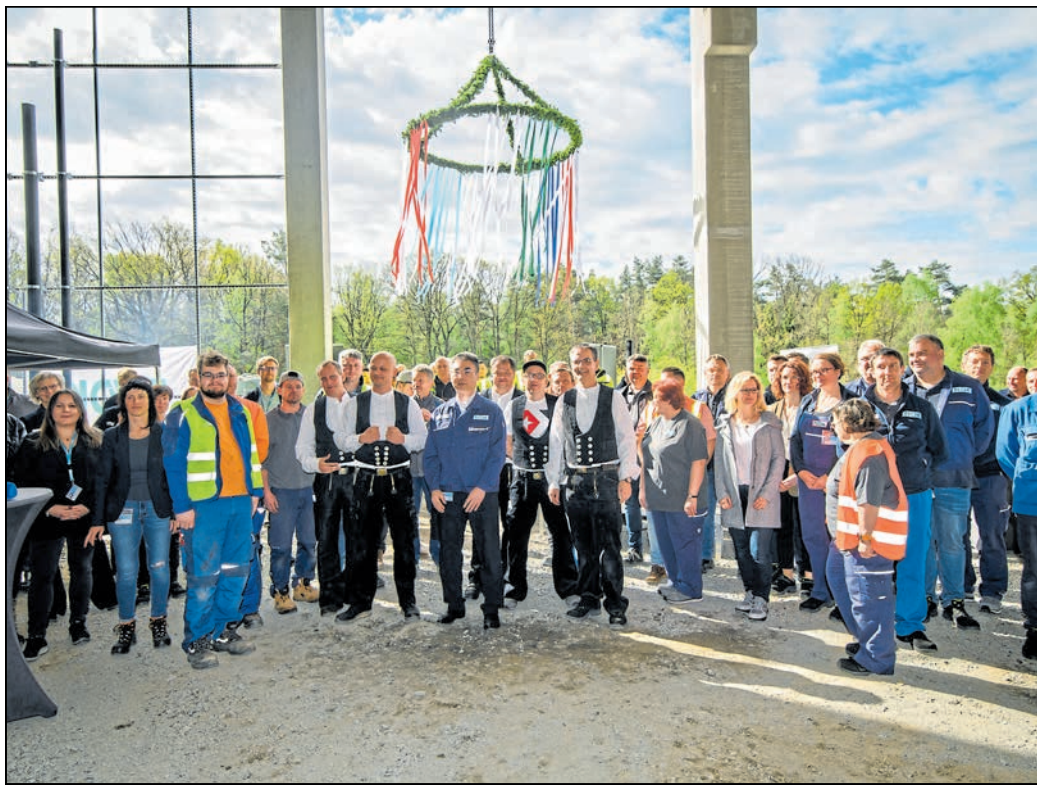
Nur zehn Monate nach Baubeginn konnte nun das Richtfest für den TDDK-Erweiterungsbau in Straßgräbchen gefeiert werden.