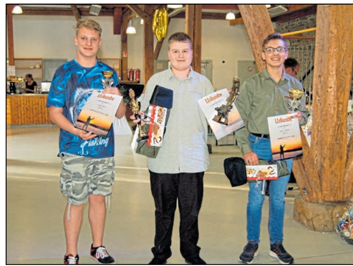
Im Rahmen der Veranstaltung wurden auch die Preisträger des Hegeangels aus der Nachwuchsgruppe ausgezeichnet.