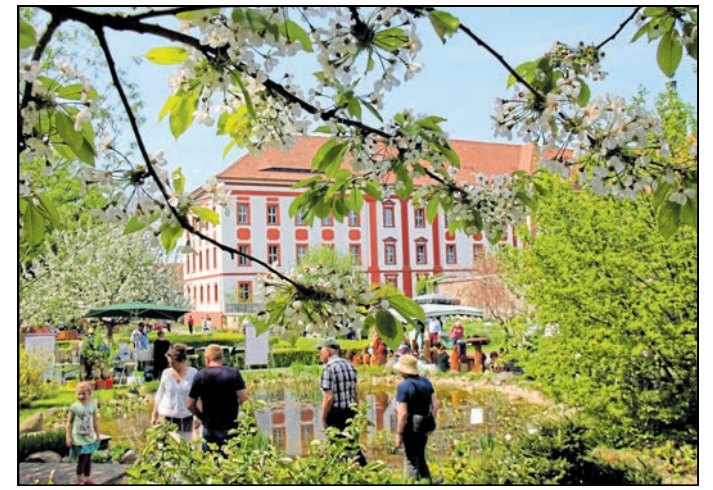
Seit 1994 haben weit mehr als 750.000 Gäste den Klostergarten besucht.