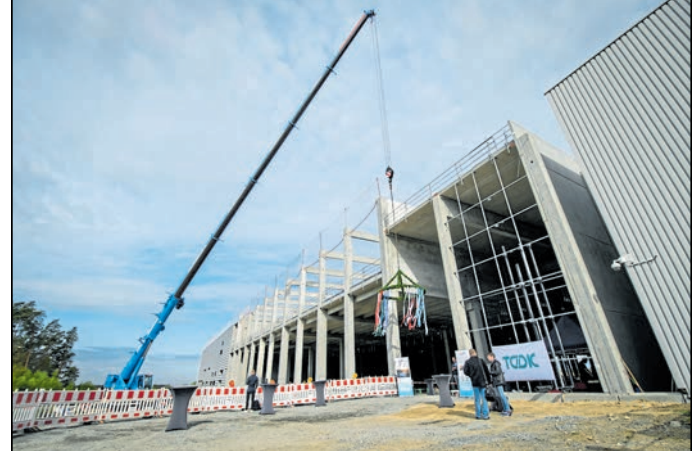
Für den Erweiterungsbau investiert TDDK bis Ende 2024 etwa 90 Millionen Euro.

TDDK bis Ende 2024 etwa 90 Millionen Euro. Die Tochter der beiden japanischen Automobilzulieferer Toyota Industries Corporation (TICO) und Denso produziert seit 2007 im Industriegebiet von Straßgräben mit nunmehr 950 Angestellten Kältemittelverdichter für PKW-Klimaanlagen der deutschen und europäischen Autowerke. PM/UM