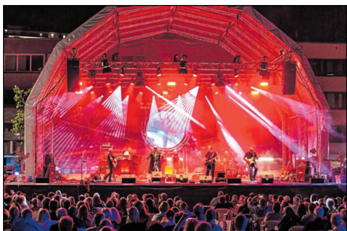
„The Spectacular Night of Pink Floyd“ möchte das Publikum mit einer authentischen und beeindruckenden Darbietung der Musik von Pink Floyd begeistern.

Karten für diese Veranstaltung gibt es im Vorverkauf beim „Oberlausitzer Kurier“ in 02625 Bautzen, Karl-Marx-Straße 4, und im Ticketshop unter www.ALLES-LAUSITZ.de.