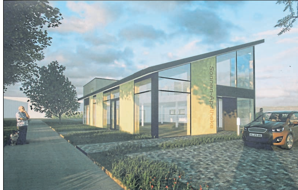
Der Architekt geht davon aus, dass Anfang Juni mit dem ersten Spatenstich der Bau der neuen Apotheke beginnen kann.