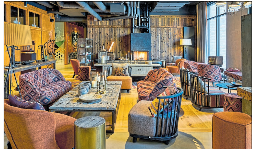
Holz-Ambiente mit Parkett-Fußboden im Hotel Freigeist in der Göttinger Nordstadt.

Parkett ist ein dauerhafter Bodenbelag mit langer Lebensdauer. Deshalb wird er gerne sogar in Gebäuden und auf Flächen genutzt, auf denen sich Menschen in großer Zahl bewegen. „Parkett wirkt elegant und der nachwachsende Rohstoff Holz strahlt zugleich Wärme und Behaglichkeit aus. Das gilt für die eigenen vier Wände ebenso wie im öffentlichen Raum. Parkett verbindet damit den in öffentlichen Gebäuden gewünschten repräsentativen Charakter mit dem natürlichen Charme eines umweltfreundlichen Bodenbelags“, erklärt so der Vorsitzende des Verbandes der Deutschen Parkettindustrie (VDP), Michael Schmid.