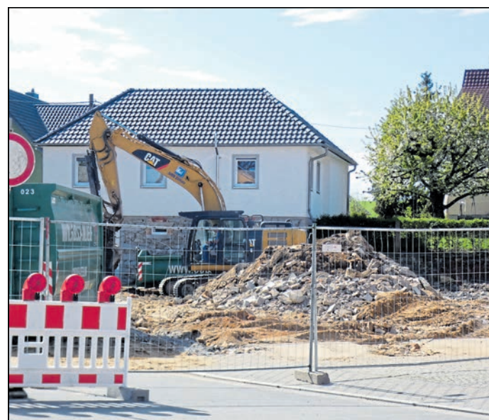
Vor einer Woche lief noch die Beräumung der letzten Bauschuttreste.

Crostwitz. Das ehemalige Crostwitzer Gemeindeamt ist in den letzten Wochen abgebrochen worden. Vor einer Woche lief noch die Beräumung der letzten Bauschuttreste. Damit hat die Gemeinde Crostwitz nach dem Abriss der ehemaligen Kita, der Erneuerung der Straße „Kirchberg“ sowie des Dorfplatzes ein weiteres großes Bauvorhaben im Zentrum ihres Hauptortes (fast) abgeschlossen. Das Gemeindeamt war ursprünglich als Konsum errichtet worden. Die Grundstücksfläche soll laut Ausschreibung nach Abschluss mit Straßenschauchotter abgedeckt werden, sodass sie befahren werden kann. Es war eine artenschutzfachliche Begleitung notwendig, um Brutversuche zu unterstützen und die Besiedlung durch Fledermäuse zu prüfen.