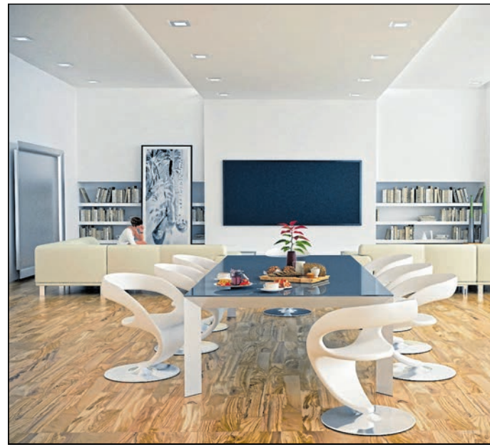
Als Parkettboden „glänzt“ Olivenholz mit besonderer Robustheit und Strapazierfähigkeit