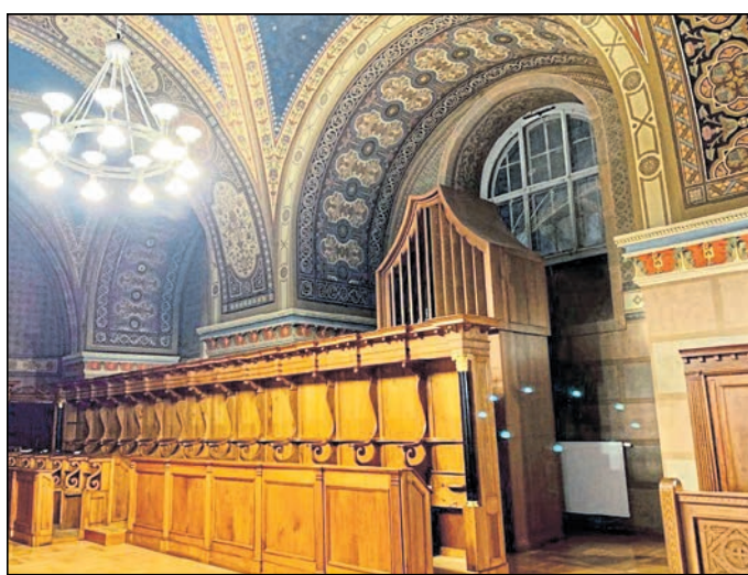
Nach wie vor spielt die Klosterorgel eine wichtige Rolle bei der Begleitung der Gottesdienste.