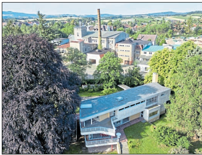
Die Nudedei neben dem Haus Schminke in Löbau soll mit verschiedenen Aktionen wiederbelebt werden.