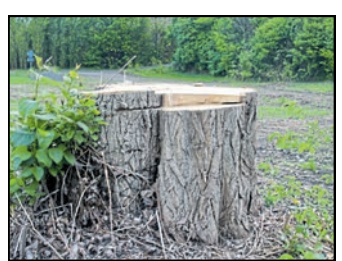
Die Bäume im unmittelbaren Kreuzungsbereich sind gerodet worden.

mend über die Humboldtstraße, den Stadtring in Richtung B 96. Aus Richtung Friedensstraße, Grenze wird der Verkehr ebenfalls über den Zittauer Stadtring geführt. Die Bauarbeiten werden voraussichtlich bis August 2025 dauern. Die Zeiten der unübersichtlichen Kreuzung an der Äußeren Oybiner Straße, Schrammstraße und Goldbachstraße sollen dann vorbei sein. Im kommenden Winter wird eine teilweise Befahrung des Knotens in Richtung Schrammstraße, Goldbachstraße angestrebt, heißt es von Seiten der Stadtverwaltung Zittau.