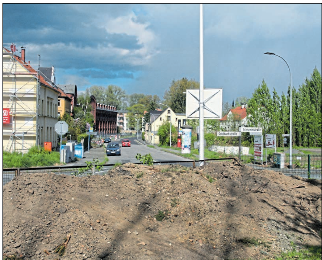
Am Knotenpunkt Schrammstraße, Äußere Oybiner Straße, Goldbachstraße in Zittau beginnen die Arbeiten für den neuen Kreisverkehr.