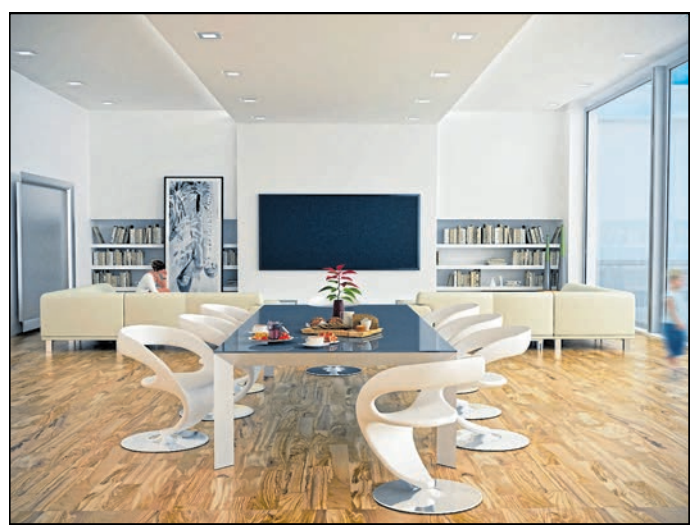
Als Parkettboden „glänzt“ Olivenholz mit besonderer Robustheit und Strapazierfähigkeit