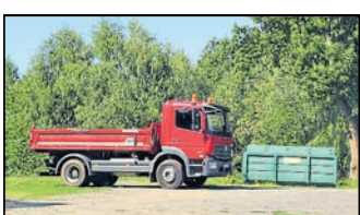
Der Mercedes Atego war in Polen neben einem Friedhof abgestellt.

Region. Ein Diebstahl vom 13. August in Rauschwalde ist aufgeklärt. Die grenzüberschreitende Arbeit der Fahndungsgruppe Neißer und der Soko Argus führte die Kriminalisten zum Erfolg. Am Dienstag konnte der Sattelzug im Wert von 66.000 Euro wenige Kilometer östlich von Görlitz im polnischen Pfaffendorf (Rudzica) sichergestellt werden. Die Kriminalpolizeiinspektion ermittelt jedoch weiter nach den Tatverdächtigen.