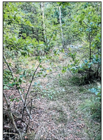
Am Waldesrand zwischen dem Teilstaubecken Reichendorf und dem Parkplatz Schäferlei verliert sich der Weg.

Zurück auf Waldhufener Gemeindegebiet stellt sich die Situation am Ende des Weges zwischen der Seeschenke und dem