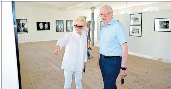
Der Görlitzer Franz-Friedrich Prinz von Preußen ließ sich bei der Ver-nissage am 20. August von Angelika Platen (links) in ihre Fotogra-fien aus fünf Jahrzehnten entführen.

Görlitz. Fotos der weltbekann-ten Fotografin Angelika Platen sind derzeit im Fotomuseum Görlitz in der Löbauer Straße 7 zu betrachten. Die bis zum 15. Ok-tober zu sehende Ausstellung „Verdopplungen“ baut auf dem Spiel doppelter Betrachtung, sei es durch eine Pose Jo-