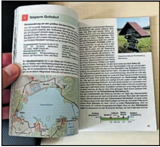
Die Wanderung über 16 Kilometer um den See wird realistisch mit vier Stunden reiner Gehzeit ausgehen.

■ Sommerzeit – Ausflugszeit. Wieso nicht einmal zu Fuß um die Quitzdorfer Talsperre? Die Redaktion hat den Weg mit seiner Gelbstrich-Markierung getestet.