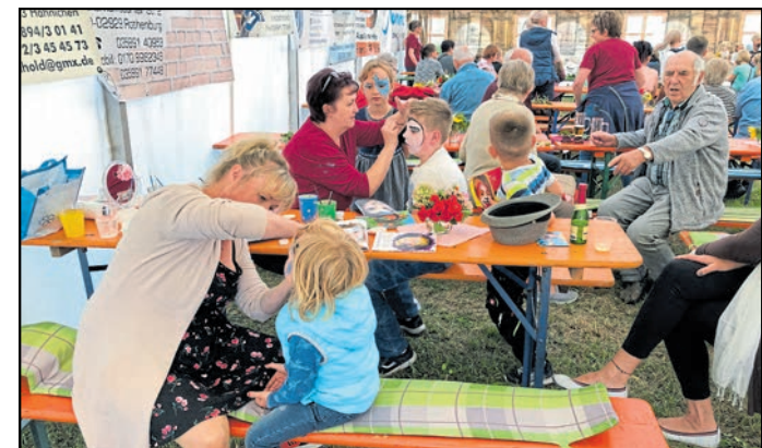
Kinderschminken, ein Klassiker auch in Noes