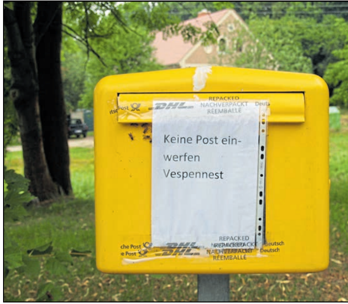
Postkuten sollten derzeit in Sandförstgen Abstand vom Briefkasten nehmen.

Sandförstgen. Die Vespa-Motorroller waren in den 50er- und 60er-Jahren Kult. Am Briefkasten in Sandförstgen in der Gemeinde Hohendubrau wird derzeit vor ihnen gewarnt – oder doch vor einem Wespenbefall? Immerhin bedeutet das italienische Vespa Wespe. Der örtliche Briefkasten ist jedenfalls mit einem Wespennest belegt.