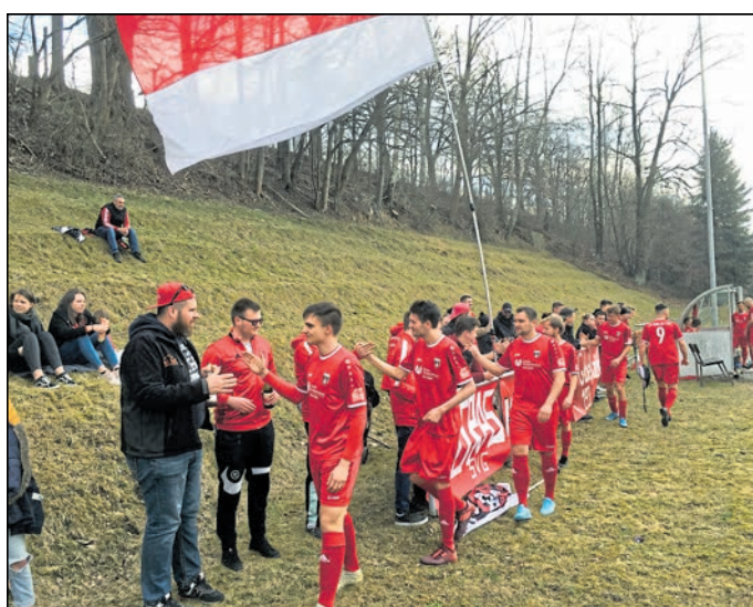
Den Gebelziger Anhang darf man durchaus als reisefreudig und enthusiastisch bezeichnen – hier bei einem Auswärtsspiel auf der Eiswiese beim SSV Germania Görlitz.

Doch wieso legte der Verein nach der Wende den zunächst wieder geführten Namenszusatz Schwarz-Gelb wieder ab? Diese Frage kann nun drei Tage lang eifrig diskutiert werden, wobei vermutet werden darf, dass man sich durch die BSG Traktor Gebelzig zu DDR-Zeiten schon zu lange an das dominierende Rot gewöhnt hatte. Till Scholtz-Knobloch