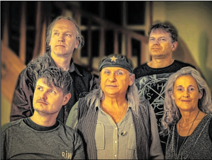
Die brandenburgische Band Shawue gibt ein Konzert im Jugendhaus Neukirch.

Neukirch. Das Jugendhaus Neukirch feiert ein besonderes Jubiläum: 30 Jahre Livemusik im historischen Stallgewölbe. Anlass ist der „Vorweihnachtsrock“ am Samstag, 13. Dezember. Headliner des Abends ist die brandenburgische Band Shawue. Seit 1987 steht die Formation für melodischen Folkrock mit deutschen Texten. Bekannt ist sie für mitreißende Live-Auftritte mit Violine und Mandoline. Der Abend ver-