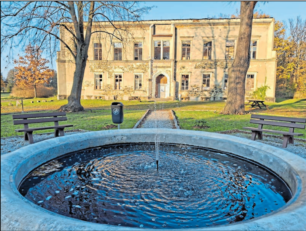
Zu den Baufeldern laut jetzt vorliegendem Bebauungsplan gehört das Schloss selbst als Pension mit zehn Zimmern.