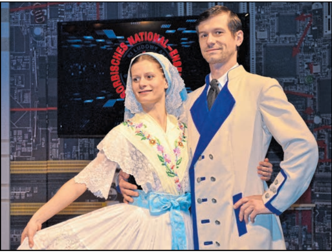
Das Sorbische National-Ensemble gehört zu den Institutionen, die über die Stiftung finanziert werden.

Bautzen. Die Stiftung für das sorbische Volk steht ab dem Jahreswechsel 2025/26 zunächst ohne unterschriebenes neues Finanzierungsabkommen da. Das aktuelle Abkommen läuft zum Ende des aktuellen Jahres ab. Dennoch hat der Stiftungsrat den Haushaltsplan für das Jahr 2026 verabschiedet. „Damit ist die weitere Finanzierung der Institutionen und Projekte im kommenden Jahr zunächst abgesichert“, teilt die Stiftungsverwaltung mit. Immerhin hat der Sächsische Landtag auf Antrag der Fraktionen von CDU und SPD einen Beschluss gefasst, mit dem die Staatsregierung ersucht wird, entsprechende Verhandlungen mit dem Bund und dem Land Brandenburg zu führen – mit dem Ziel,