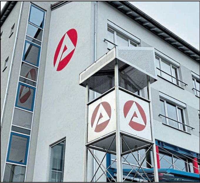
Die Agentur für Arbeit Bautzen in der Neusalzaer Straße 2 in Bautzen steht Arbeitgebern mit spezialisierten Teams zur Verfügung, um ältere Kollegen im Unternehmen zu halten.