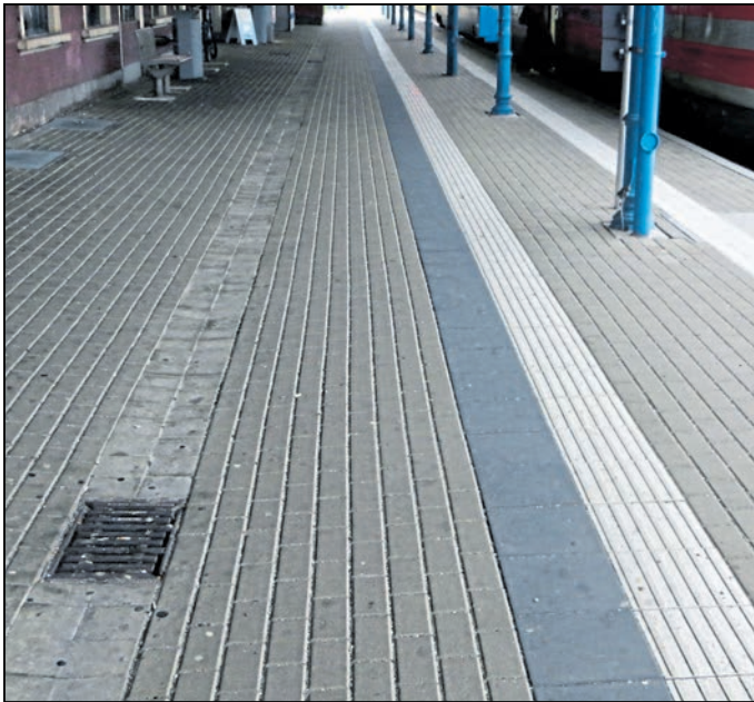
Diese weißen Streifen, genannt „Bodenindikatoren“, am Bahnhof Kamenz weisen Blinden und Sehbehinderten den Weg.