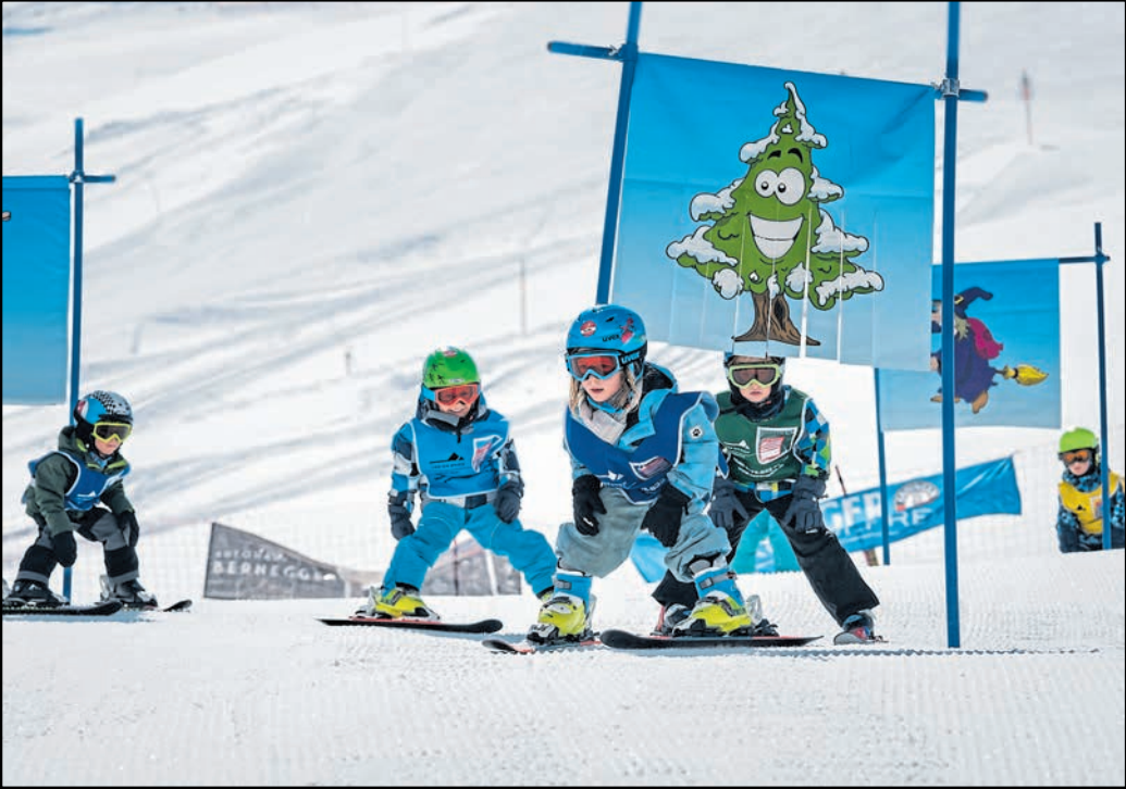
Junge Skifahrer wagen im Kinderareal ihre ersten Schwünge.

Das Skiparadies Sudelfeld verbindet Erreichbarkeit, Komfort und ein vielfältiges Wintersportangebot auf einzigartige Weise. Hier verschmelzen winterliche Naturerlebnisse mit familiärer Herzlichkeit zu einem Winterurlaub, der in Erinnerung bleibt – ein Wintermärchen, nur eine gute Stunde von München entfernt.