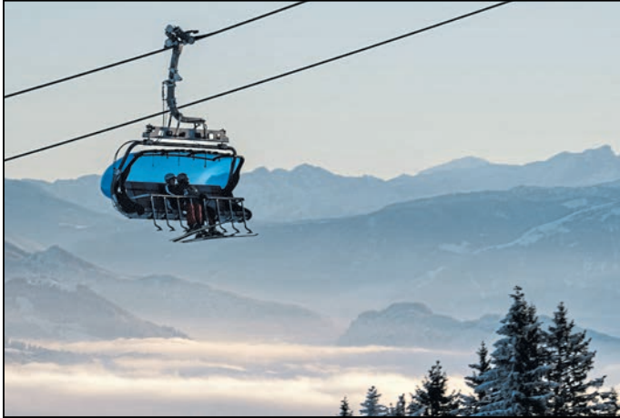
Moderne 6er- und 8er-Sesselbahnen bringen die Gäste komfortabel und zügig von der Talstation hinauf zu weitläufigen Pisten.

Die Gastfreundschaft zeigt sich auch abseits der Hänge – zehn urige Berggasthöfe mit Sonnenterrassen und bayerischen Schmankerln laden zum