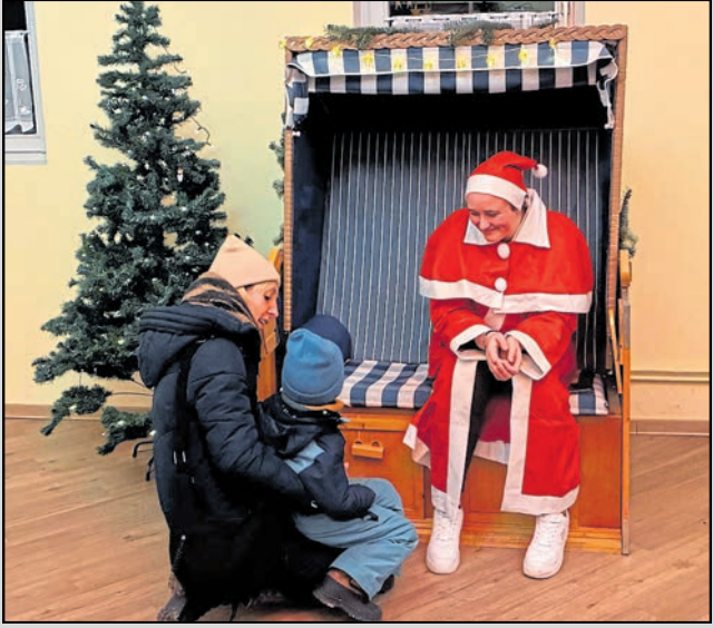
Kamenz. Der Verein Tomogara Ryu e. V. blickte auf eine lange Tradition zurück. Zum 35. Mal in Folge veranstaltete er in diesen Tagen in Kamenz seine beliebte Kinderweihnachtsfeier. Knapp 80 kleine Gäste wurden zwei Stunden lang von den Karate-Juniors und zahlreichen erwachsenen Helfern betreut. Ein abwechslungsreiches Programm bot für jeden etwas: von einer Bastel- und Holzwerkstatt bis zum Besuch der Weihnachtsfrau. Auch Leckereien wie Lebkuchen und Spiele wie Ringewerfen gehörten dazu. Die ablenkungsreiche Zeit verging für die Kinder wie im Flug. Den feierlichen Abschluss bildete traditionsgemäß ein stimmungsvoller Lampionumzug. Der Verein bedankt sich bei allen Helfern und Teilnehmern. (Verein)