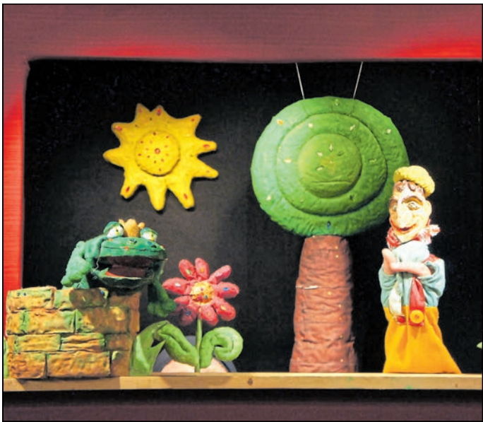
Ab 11.00 Uhr bietet das Puppentheater auf der Erlebnissbühne Unterhaltung für die Gäste.

Bischofswerda. Am Mittwoch, 24. Dezember , startet der Zoo Bischofswerda in ein tierisches Weihnachtsfest. Ab 10.00 Uhr besucht der Weihnachtsmann mit seinen Helfern die Gehege. Sie verteilen liebevoll verpackte Geschenke an die Tiere. Diese enthalten kleine Leckereien und spielerische Überraschungen. Für die Besucher wird diese besondere Fütterung zu einer weihnachtlichen Tour. Dabei erfahren vor allem Kinder, wie wichtig ein respektvoller Umgang mit Tieren ist. Ab 11.00 Uhr bietet das Puppentheater auf der Erlebnissbühne Unterhaltung für die Gäste. Gezeigt wird das Märchen „Der Froschkönig“ der Gebrüder Grimm. Für das leibliche Wohl sorgt der Tierparkförderverein an seinem Stand.