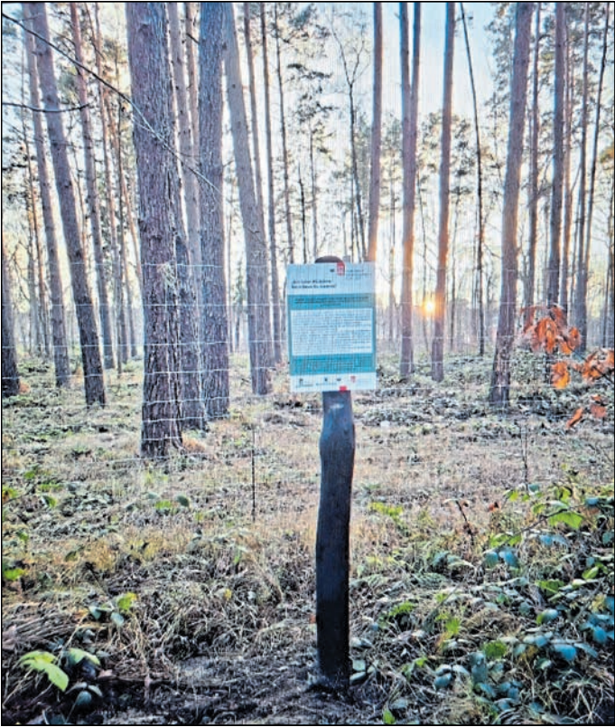
Das von vielen Spenderinnen und Spendern gewünschte Schild wurde jetzt aufgestellt.