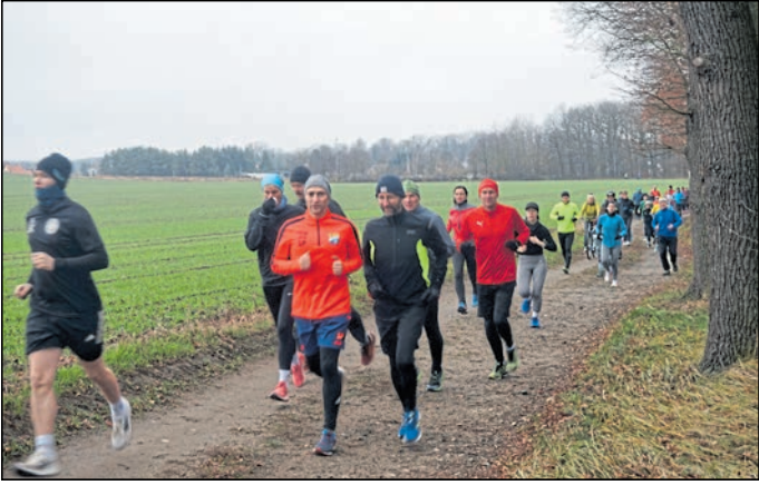
Am Freitag, 26. Dezember, lädt der SV Aufbau Deutschbaselitz zum 25. Gansabrennen ein.

Deutschbaselitz. Am Freitag, 26. Dezember, lädt der SV Aufbau Deutschbaselitz zum 25. Gansabrennen ein. Der traditionelle Volkssportvormittag beginnt um 10.00 Uhr am SFZ Deutschbaselitz. Die Teilnehmer erwartet eine 5-km-Runde um den Deutschbaselitzer Großteich. Die flache Strecke ist für alle geeignet, egal ob zu Fuß, per Fahrrad oder mit Kinderwagen. Es gibt keine