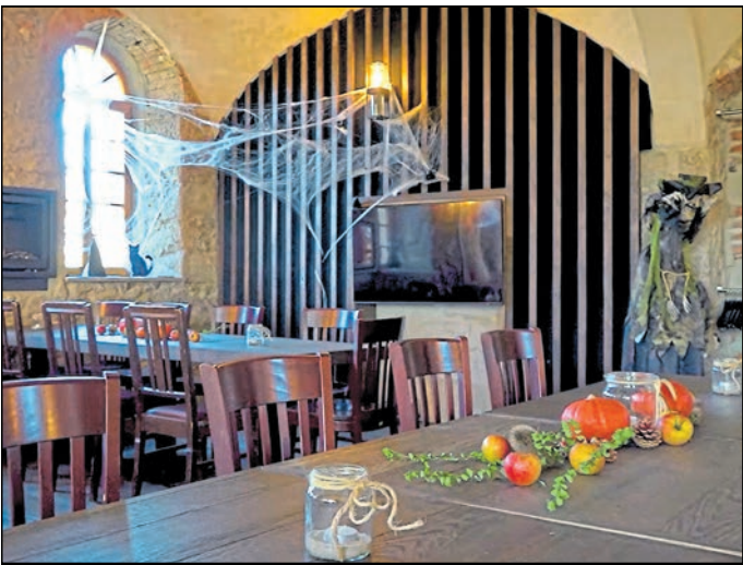
Das Burgtheater – hier für Halloween dekoriert – gibt den meisten Gästen den ersten Eindruck.