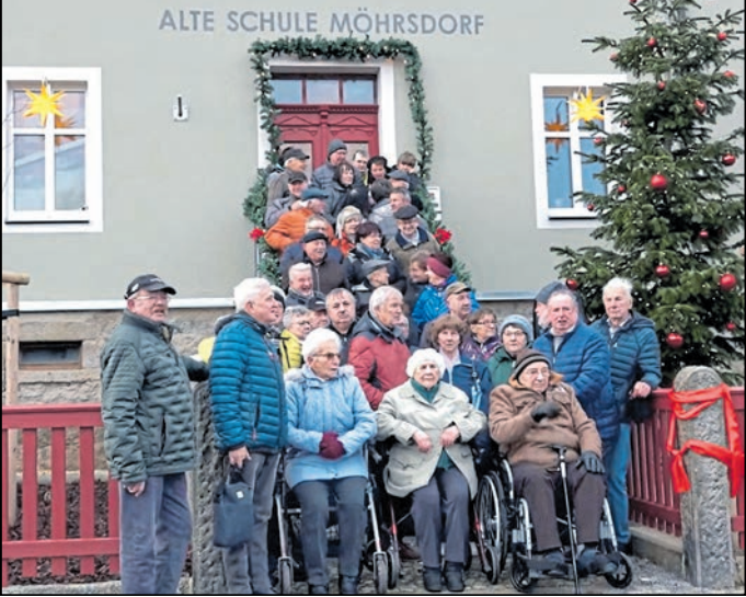
Trotz des eisigen Windes und der kalten Temperaturen wollten alle dabei sein.

Neukirch/Lausitz. Der Jugendbeirat der Gemeinde Neukirch/Lausitz startet eine umfassende Bürgerbefragung zur Gemeindegeldentwicklung. Alle Einwohner sind ab sofort bis zum 31. Dezember eingeladen, ihre Meinung einzubringen. Die Umfrage soll ein aktuelles Stimmungsbild zu zentralen Themen liefern. Sie richtet sich bewusst an Bürgerinnen und Bürger aller Altersgruppen. Befragt wird unter anderem zur Lebensqualität, Mobilität sowie zu Freizeit- und Naherholungsangeboten. Ein besonderer Fokus liegt auf den Bedürfnissen von Kindern, Jugendlichen, Familien und Senioren. Die Teilnahme ist anonym und kann online unter: survey.lamapoll.de/BuergerbefragungNeukirch2025 erfolgen. Alternativ liegen Fragebögen im Jugendhaus und in der Gemeindeverwaltung aus. Die Ergebnisse werden im Januar 2026 ausgewertet und sollen als Grundlage für die künftige Projektplanung dienen. Der Jugendbeirat möchte mit dieser Aktion die Beteiligung aller Generationen stärken. Ziel ist es, die Angebote der Gemeinde noch besser an den Bedürfnissen der Bevölkerung auszurichten.