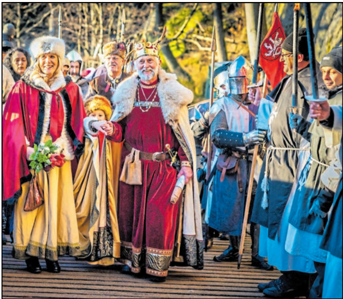
Die Oybiner und ihre Gäste feiern die traditionelle Kaiserweihnacht auf dem Berg Oybin.

Oybin. Die Vergangenheit lebt bei der traditionellen Kaiserweihnacht am Donnerstag, 25. Dezember, auf der romantischen Burg- und Klosteranlage Oybin. Kaiser Karl IV. zieht um 14.30 Uhr mit Gemahlin und Gefolge mit einem Festumzug über die Hauptstraße hinauf zum Haus des Gastes und dann auf den Oybin zur weihnachtlichen Andacht. Historischer Hintergrund: Kaiser Karl IV. stiftete am 17. März 1369 zu Lucca dem Orden der Cölestiner das Kloster auf dem Oybin. Am 25. Dezember desselben Jahres soll er auf dem Oybin geweiht haben. Aus diesem Anlass fand 1994, dem „625. Jahrestag“, die erste Kaiserweihnacht statt, die zu einer guten Tradition geworden ist.