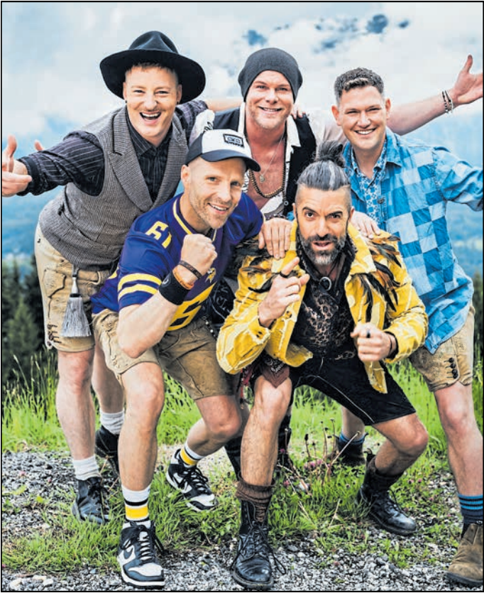
voXXclub macht auf seiner Lederhos’n Inferno-Tour am Donnerstag, 12. März 2026, um 20.00 Uhr, in der Messe- und Veranstaltungshalle Löbau Station.

men. Das Publikum ist interaktiv bei den Showaktionen dabei. Mitsingen ist natürlich Pflicht. Und die verrückt-verspielte Kreativität der voXXclubber ist immer für eine Überraschung gut. Das neue ‚Lederhos’n Inferno‘ – da kommt was auf das Publikum zu!“ Karten für diese Veranstaltung gibt es im Vorverkauf beim „Oberlausitzer Kurier“, Karl-Marx-Straße 4, in 02625 Bautzen und im Ticketshop unter www.ALLES-LAUSITZ.de . Unsere Geschäftsstelle hat am 22. und 23. Dezember für Sie geöffnet. Am 24. Dezember, am 29. Dezember, am 30. und am 31. Dezember bleibt unsere Geschäftsstelle geschlossen. Ab dem 2. Januar sind wir wieder wie gewohnt für Sie da.