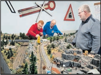
Die Modellbahner haben die H0-Clubanlage „Radeburg“ mit Schmalspurbahn und die TT Modularanlage aufgebaut.

ten Nachtfahrten werden die Besucher begeistern. Eine kleine Modellbahnbörse lädt zum Fachsimpeln und Stöbern ein.