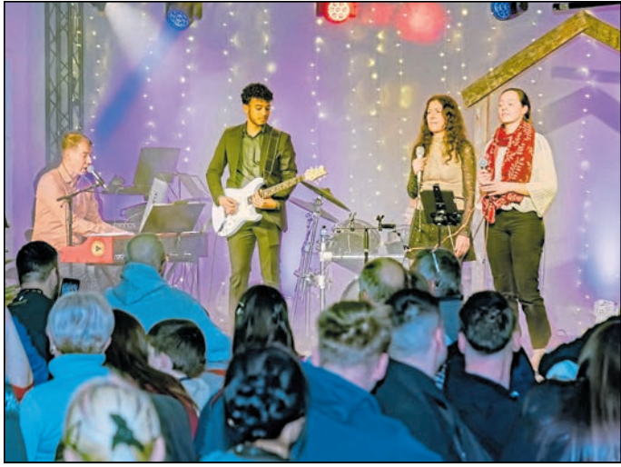
Die Besucher erwartet im Begegnungszentrum Lausitzer Granit in Löbau ein abwechslungsreiches Programm.

herzigen Gemeinschaft. Wir freuen uns auf Ihr Kommen“, heißt es dazu von Seiten des Veranstalters.