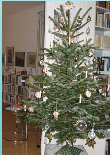
Ein Christbaum in der eigenen Stube ist eine typisch deutsche Tradition, die weltweit Karriere gemacht hat.

Bei der Auswahl des richtigen Baumes bleibt man natürlich gerne bei einem heimischen Baum. Doch wie viele Bereiche der Land- und Forstwirtschaft, so sind auch Weihnachtsbaumerzeuger stark vom Wetter abhängig. Kurz vor Weihnachten kann es witterungsbedingt vorkommen, dass Erzeuger deshalb in logistische Schwierigkeiten kommen. Das ist gerade in Familienbetrieben oft der Fall. Wer einen heimischen Baum aus der Region aufstellen möchte, sollte in diesem Verständnis diese Überlegungen in die Findung des richtigen Kauftermins einbeziehen – zumindest in künftigen Jahren, wenn es für dieses Jahr schon zu spät sein sollte... tsk